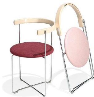
Relaunch einer Designikone aus den 80er Jahren – Klappstuhl 2750 Sóley, Design by Valdimar Harðarson