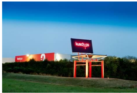
Werk 2. Schon von weitem signalisiert der wohl größte Serienstuhl der Welt, wo Kusch+Co zu finden ist.