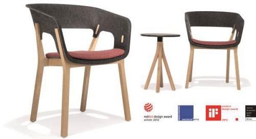
Bequem wie ein Sessel, leicht wie ein Stuhl – Programm 3000 Njord. Design by Scaffidi & Johansen.