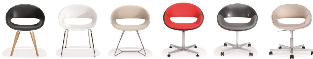
Verschiedene Bereiche formal durchgängig einrichten – Programm 8250 Volpino, Design by Norbert Geelen.