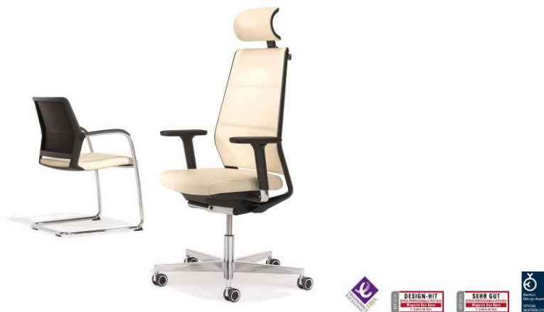
Design und Ergonomie in Bestform – Programm 6000 São Paulo, Design by Norbert Geelen.