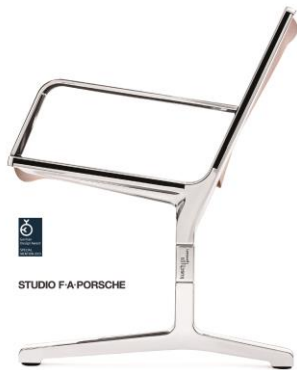
Programm 8000 für Airport und Public Seating, Design by Studio F .A. Porsche