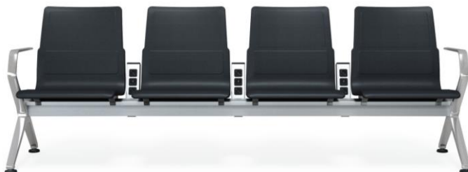
Programme 8300 und 8350 V-Travel für Airport und Public Seating, Design by Justus Kolberg

Jüngste Innovation sind die Programme 8300 und 8350 V-Travel, die gemeinsam mit dem Designer Justus Kolberg entwickelt wurden. Eine neue Generation von Wartebänken, vor allem geschaffen für die Flughäfen, die sich zunehmend auch als Shopping- und Erlebnisbereiche verstehen. Die Bänke in Traversenkonstruktion mit Klemmtechnik sind hochflexibel und ermöglichen durch ihr Grundraster flächenoptimierte Möblierungen mit idealer Raumnutzung. Ergänzt werden sie durch freistehende Sitzinseln als besonders komfortable Sitzgelegenheiten und attraktive Blickfänge.