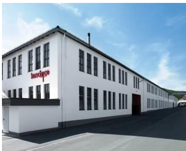
Werk 1. Verwaltung; Holzvorfertigung und Tischbau.

Kusch+Co gehört zu den führenden Herstellern hochwertiger Sitzmöbel, Tische und Tischanlagen in Premiumqualität mit hohem Design- und Funktionsanspruch für den Objektbereich. Verwaltung und Produktion befinden sich seit 1939, dem Gründungsjahr des Unternehmens, in Deutschland. Traditioneller Firmensitz ist Hallenberg in Nordrhein-Westfalen. Dort fertigt Kusch+Co seine Produkte mit qualifizierten Mitarbeitern, wobei handwerkliches Können und modernste technische Verfahren zusammenwirken.